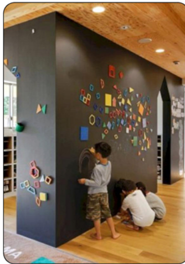
Ruang dapur / lemari